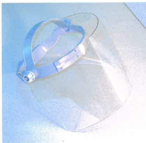
Ostona twarzy, typ B1/1.0, B1/1.5